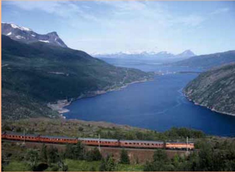
Oftobanen: Skandinavias vakreste togreise