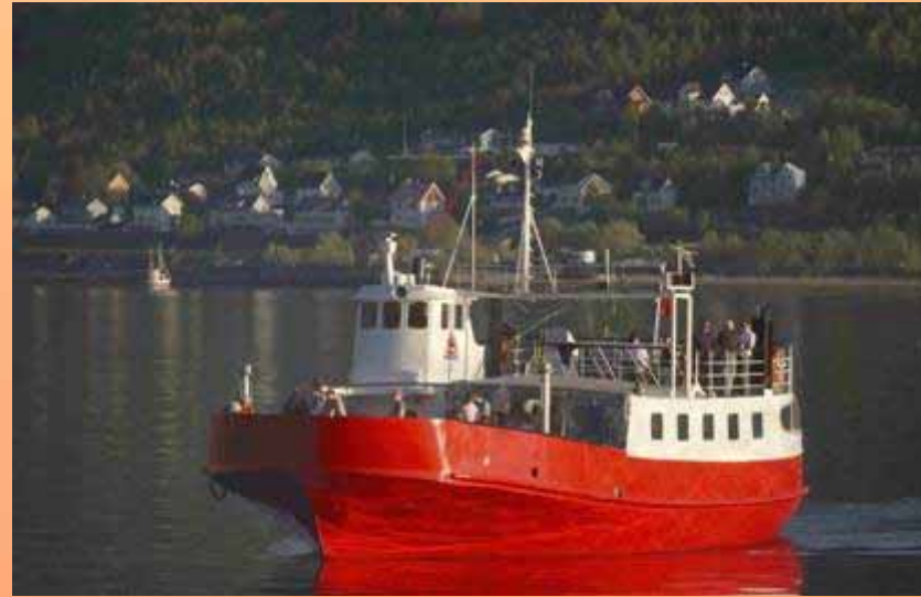
Gjøa: Vår base for fjordturen. Servering og ren nytelse